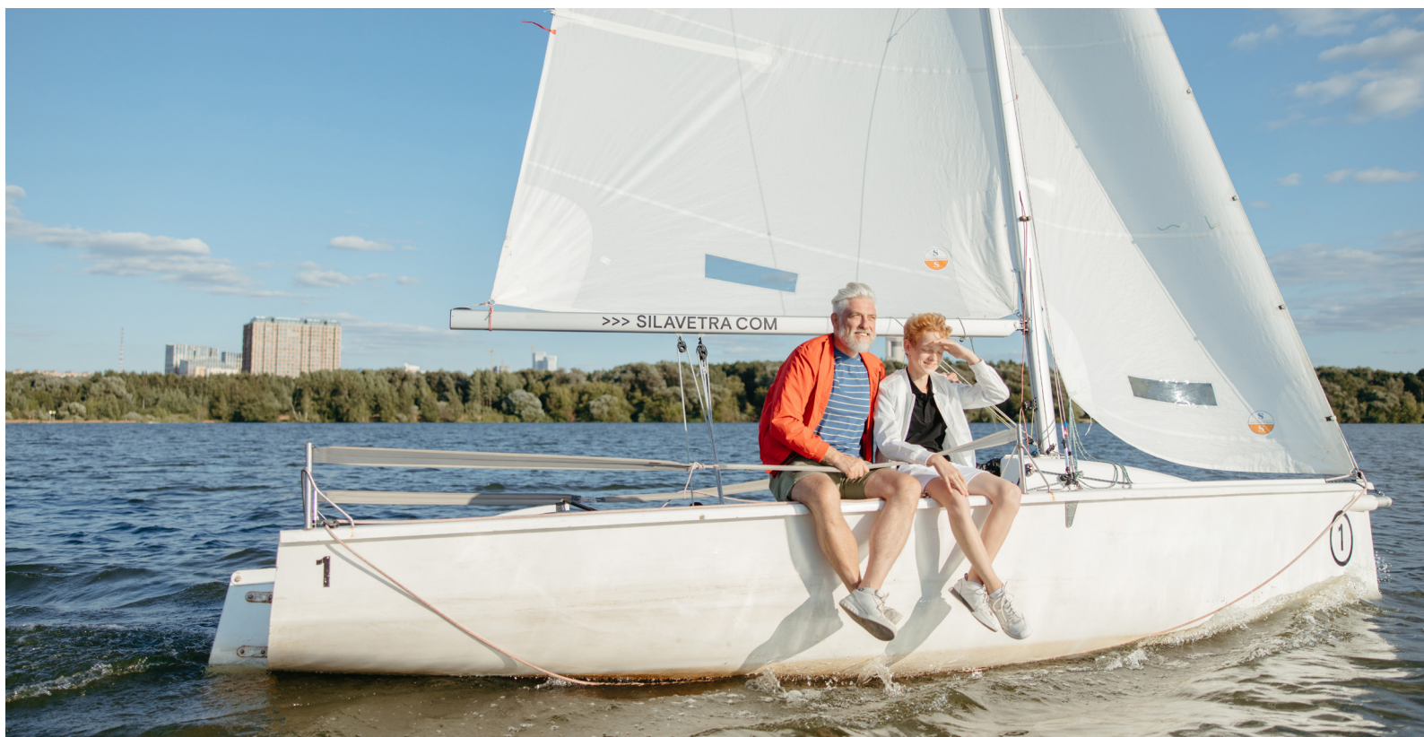
Grossvater und Enkel

benken marthalen ossingen rheinau trüllikon truttikon