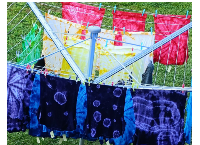
Die gefärbten Lager-Shirts