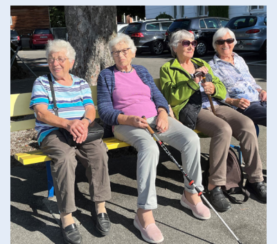
Die Sonne im Herzen und im Gesicht