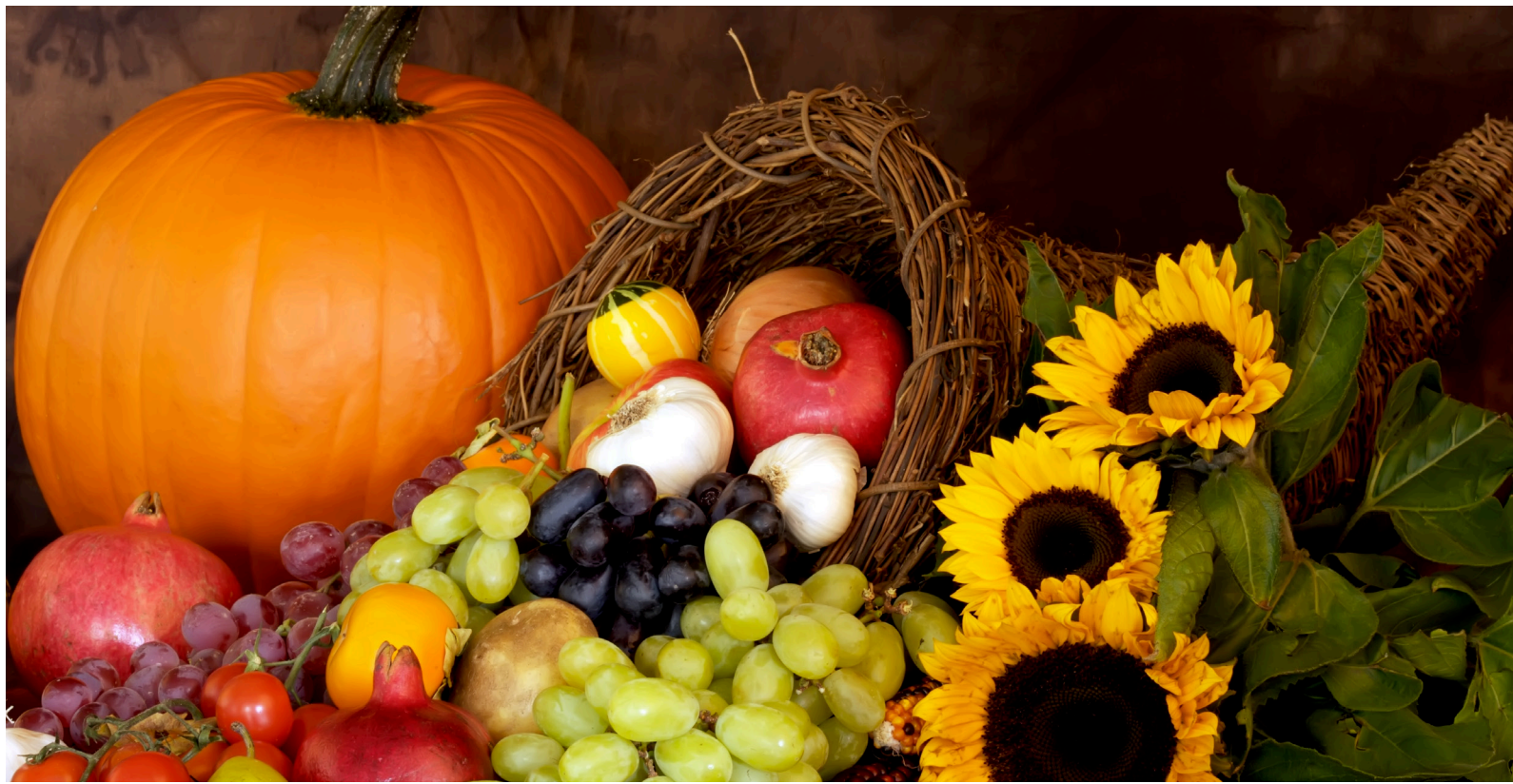
Herbst – Zeit der Ernte

benken marthalen ossingen rheinau trüllikon truttikon