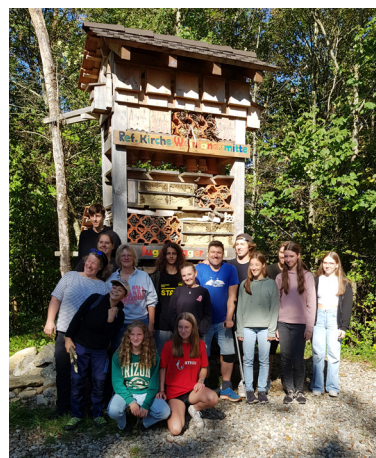
Fleissiges Team nach der Reparatur