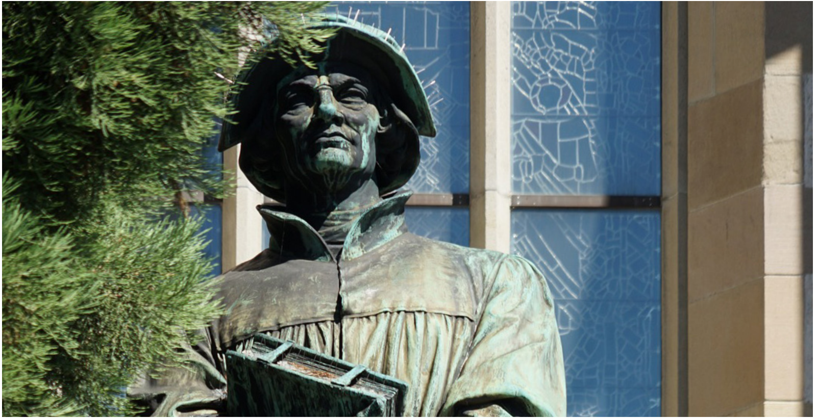
Das Denkmal des Reformators Huldrych Zwingli vor der Wasserkirche in Zürich

benken marthalen ossingen rheinau trüllikon truttikon