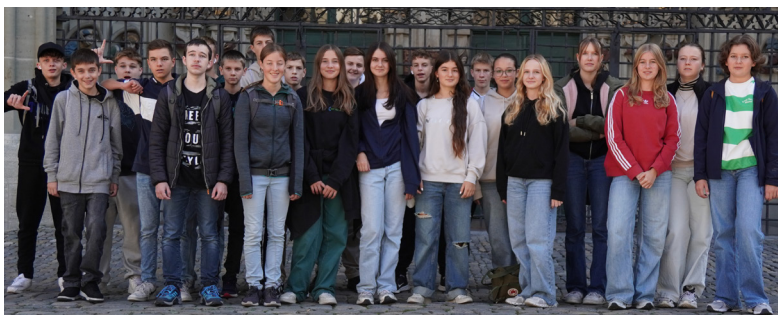
Die beiden Konfklassen gemeinsam unterwegs