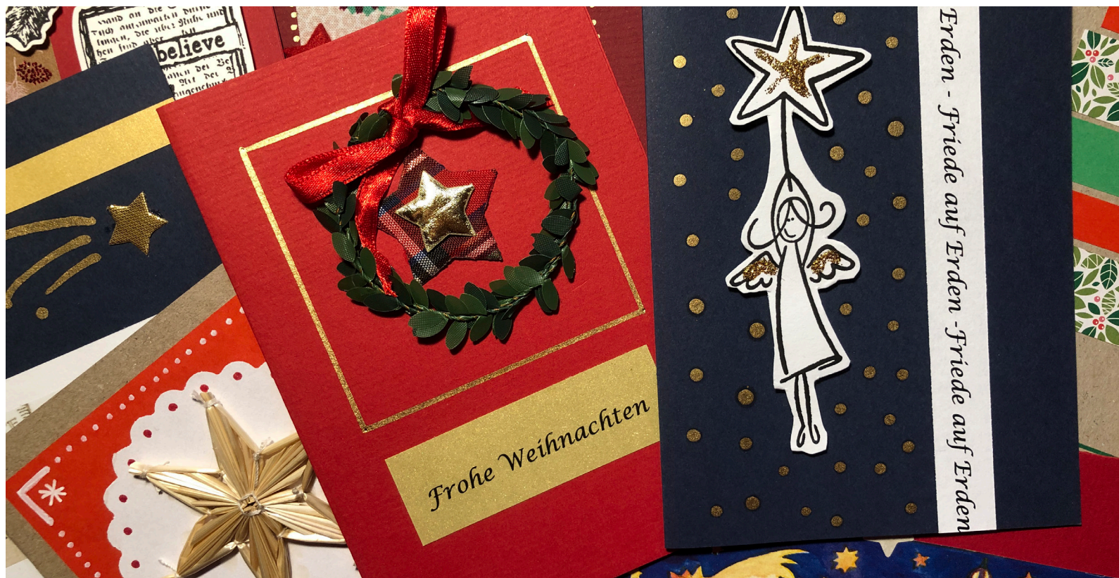
Freude bereitende Weihnachtskarten

benken marthalen ossingen rheinau trüllikon truttikon