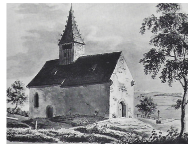
Stand bis 1855 im Unterdorf. Die mittelalterliche Filialkapelle

(Parkplätze Restaurant Ochsen freihalten und öffentliche Parkplätze benutzen, weitere Infos auf www.kirche-wm.ch )