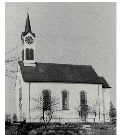
Hat nur 100 Jahre überdauert. Die 1856 erstellte Dorfkirche

* Gedenkschrift an den Bau der neuen Kirche Truttikon (1961)