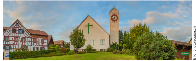
Die 1960 erbaute Kirche Truttikon

Nach der Reihe «Wer/Was ist ...» beginnen wir in dieser Ausgabe die Themenreihe über unsere Kirchengebäude. Caspar Heer aus Benken wird in den kommenden Ausgaben Spannendes aus der Geschichte der einzelnen Kirchen von Weinland Mitte berichten.