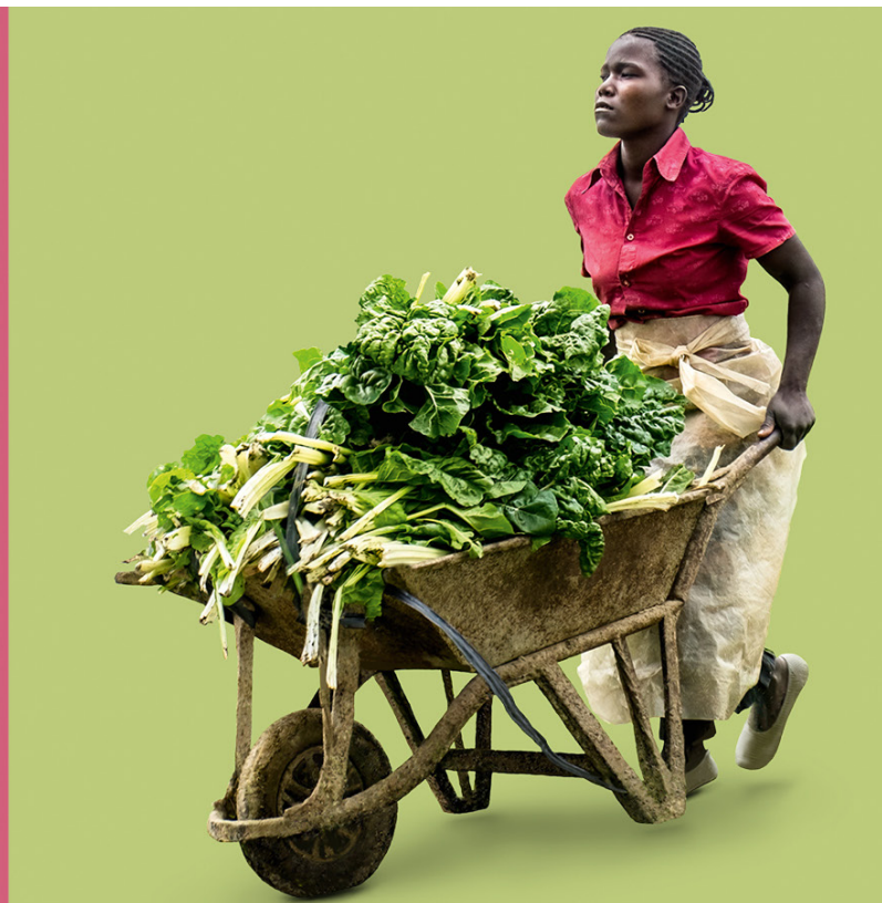
«Weniger ist mehr» – so lautet das Motto der diesjährigen ökumenischen Kampagne von Fastenaktion und Heks/Brot für alle