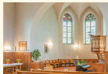
Blick zum Chor mit Kanzel und Taufstein