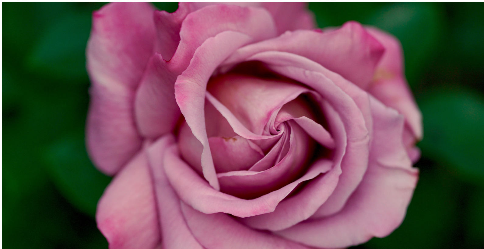
Rose – die Königin der Blumen