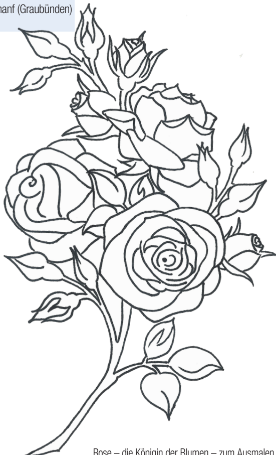
Rose – die Königin der Blumen – zum Ausmalen

13.–18. August 2023, S-charf (Graubünden)