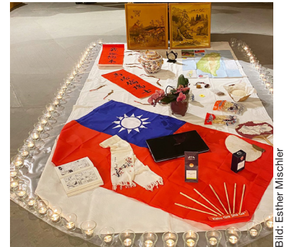
Fremdartiges aus und über Taiwan in Marthalen