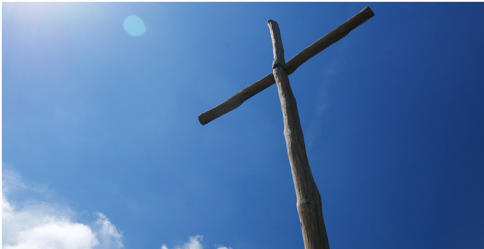
Das Kreuz erinnert uns an den Tod von Jesus. An Ostern feiern wir, dass er auferstanden ist.

benken marthalen ossingen rheinau trüllikon truttikon