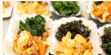
Feine regionale Chips

etwas nachhaltigeren Welt beitragen. So können wir auch im Kleinen Grosses bewirken.