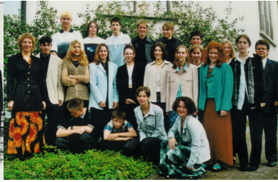
Konfirmation im Jahr 1998

Zum Gottesdienst am Palmsonntag laden wir speziell all diejenigen ein, die ihr 50- oder 25-Jahr-Konfirmations-Jubiläum feiern. Der Gottesdienst, der vom Frauenchor Marthalen bereichert wird, beginnt ausnahmsweise um 10 Uhr, damit auch jene mit einer längeren Anreise nicht allzu früh aufstehen müssen. Und vielleicht kommen Sie beim anschliessenden Apéro wieder einmal ins Gespräch mit jemandem, den oder die Sie schon