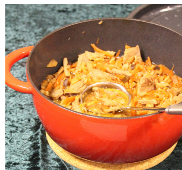
Chao Mi Fen (Nudeln mit Fleisch und Gemüse)