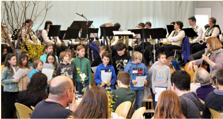
Die Unti-Kinder beim Singen

Auch in diesem Jahr war der Brot-für-alle-Tag in der Mehrzweckhalle in Trüllikon ein schöner Anlass. Gemeinsam mit Helfenden aus Benken und Trüllikon wurde angepackt, und aus der Turnhalle wurde ein Ort der gemütlichen Begegnung. Untermalt wurde der ökumenische Gottesdienst mit lässigem Sound der Musikgesellschaft Andelfingen.