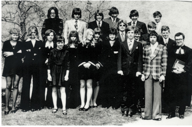
Konfirmation im Jahr 1973