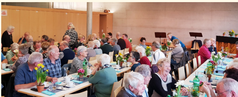
Gemütliches Beisammensein nach dem Suppenessen