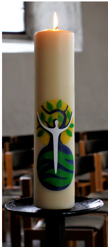
Symbol für Jesus als Sieger über den Tod