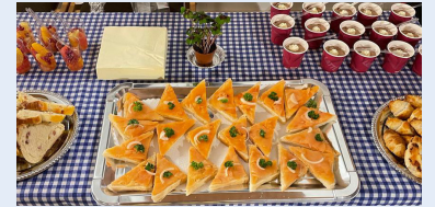
Köstlichkeiten der Trachtenfrauen Marthalen

Wer diese wunderbar klingende Feier verpasst hat, kann sich eine Aufzeichnung davon auf unserer Internetseite anhören und anschauen. Feine Häppchen im Anschluss werden Sie sich aber selber zubereiten müssen. (EvL)