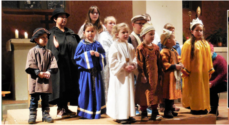
Rheinau: Kinderklub-Weihnacht «De neu König»