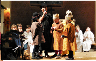
Bilder: Werner Schweizer