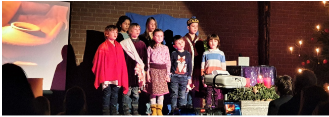
Trüllikon: Krippenspiel «Reportage aus Bethlehem»