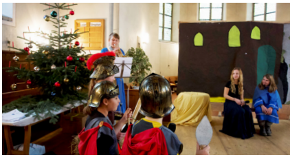
Benken: Weihnachtsspiel «Marias kleiner Esel»