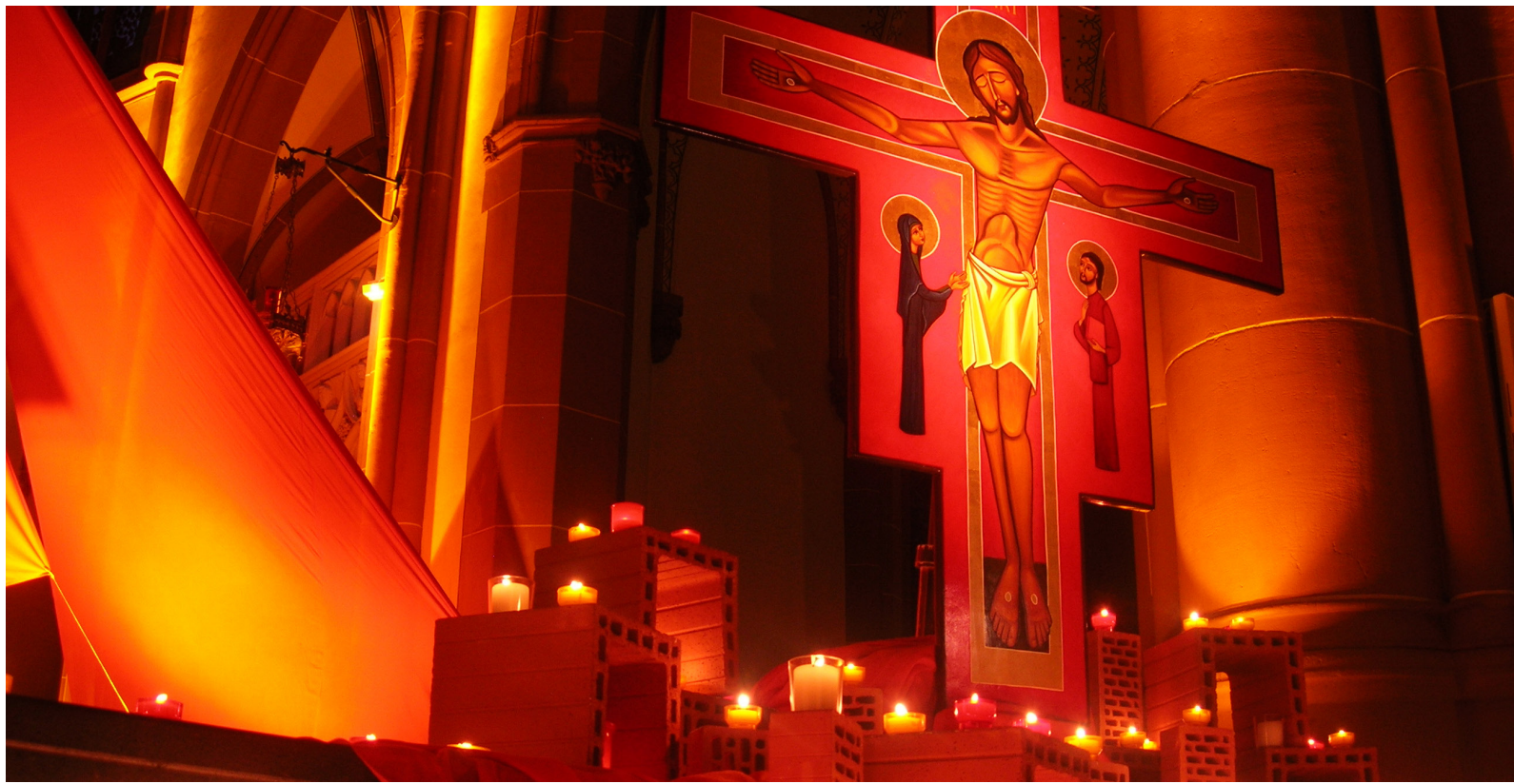
Taizé-Gottesdienst mit Kreuz, vielen Lichtern und Tüchern