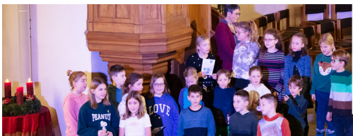
Marthalen: Familien-Weihnachtsfeier «Sterntaler»