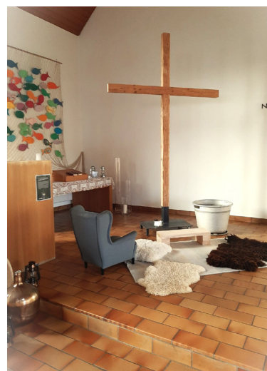
Letztjährige Gebetswoche in der Kirche Truttikon

Gebetswoche 8.–15. September 2024 Kirche Benken Weitere Informationen: www.kirche-wm.ch