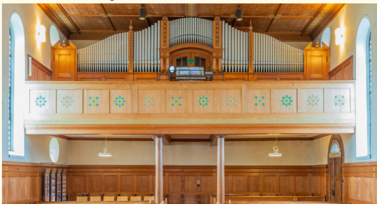
Die Orgel der Kirche Ossingen feierte im Jahr 2022 ihr 100-Jahr-Jubiläum

Diese barocke Landkirche mit ihrem mächtigen Turm wirkt wie aus einem Guss. Doch das täuscht. Immer wieder wurde sie dem Zeitgeschmack entsprechend verändert. Von der ursprünglichen Ausstattung sind nur die Kanzel und der Pfarrstuhl erhalten geblieben. Mitte des 19. Jahrhunderts in neugotischem Stil umgestaltet, wurde sie bereits bei der Renovation von 1922 nochmals umgeprägt, diesmal im sogenannten Heimatstil. Und der wurde nicht etwa später weggeputzt, wie beispielsweise in der Benkemer Kirche, sondern blieb bis heute erhalten. So sind die Kirchenbänke, die Holzdecke, die geschwungene Orgel und die Ornamentmalereien alle Zeugen der letzten Renovation. Das hat Seltenheitswert, stellt die kantonale Denkmalpflege fest und spricht von einem «baukünstlerisch wertvollen, stimmigen Erscheinungsbild».