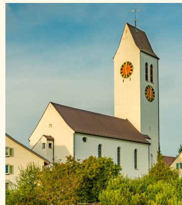
Die Kirche Ossingen

Poststrasse 6, 8462 Rheinau rahel.schoenberger@kirche-wm.ch 078 711 35 07