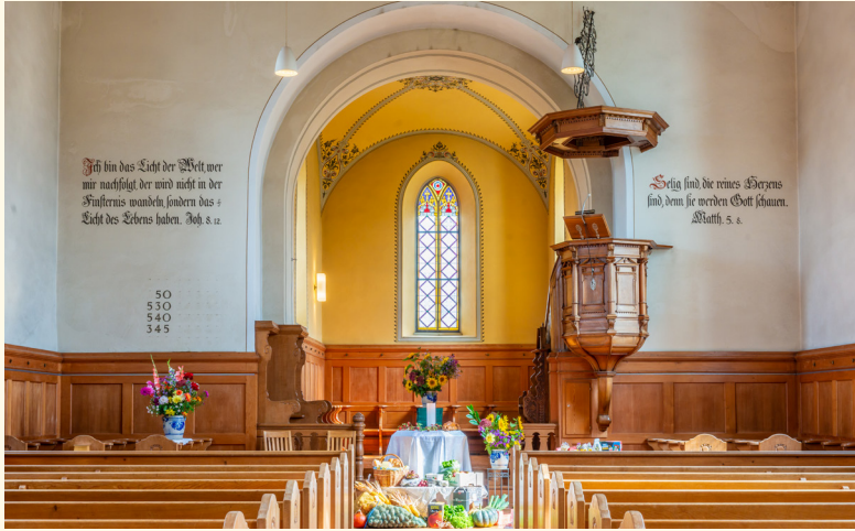
Kirche Ossingen mit Blick zum Chor

In dieser Themenreihe berichtet Caspar Heer Spannendes aus der Geschichte der einzelnen Kirchen von Weinland Mitte.