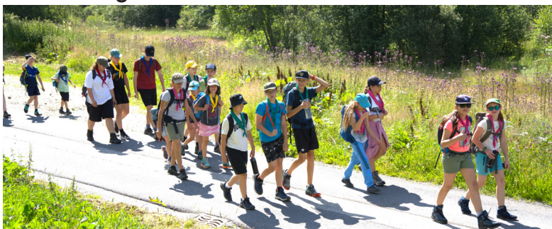
Unterwegs auf dem Neat-Weg