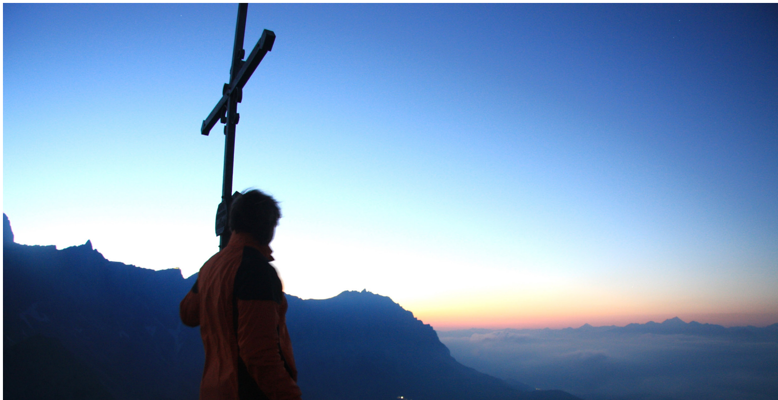
Die Praxis des frühen Aufstehens und des Wanderns kann dazu beitragen, Ruhe und Besinnung zu finden. (Sagt meine Frau, Ich bleibe lieber im Bett. MIG)

benken marthalen ossingen rheinau trüllikon truttikon