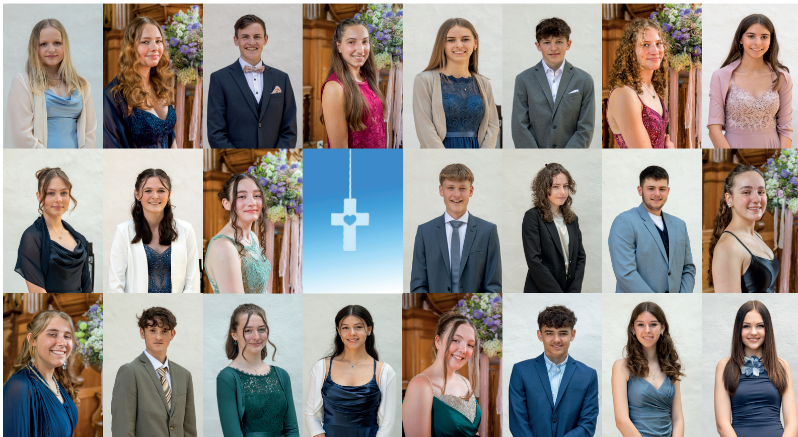
Konfirmanden 2025 unserer Kirchgemeinde Weinland Mitte

benken marthalen ossingen rheinau trüllikon truttikon