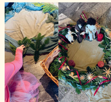
Fiire mit de Chliine