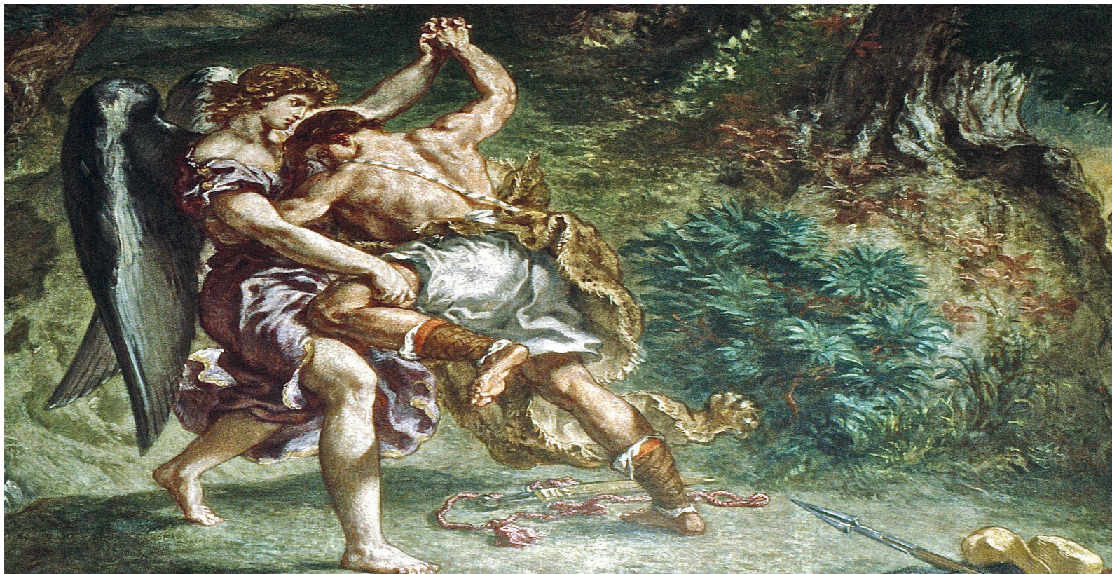
Ausschnitt aus dem Bild «Kampf Jakobs mit dem Engel» von Eugène Delacroix.

benken marthalen ossingen rheinau trüllikon truttikon