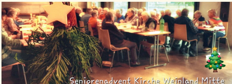
Seniorenadvent Kirche Weinland Mitte