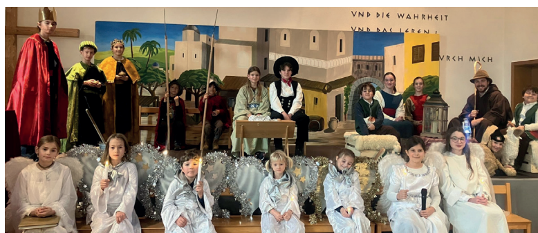
Truttikon: «Der bedeutungsvolle Stern»