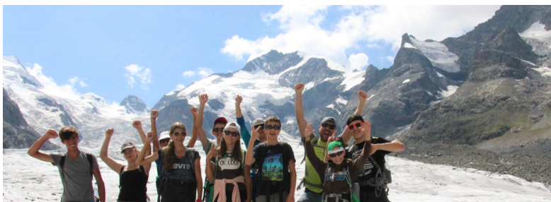
Foto aus dem Jugendlager 2020

Aktive Ferien in den Bergen, Freundschaften schliessen, Herausforderungen erleben, Gemeinschaft geniessen.