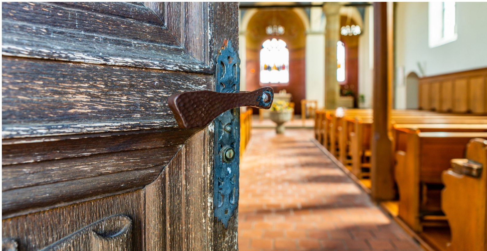
Die offene Eingangstüre zur Bergkirche in Rheinau

benken marthalen ossingen rheinau trüllikon truttikon