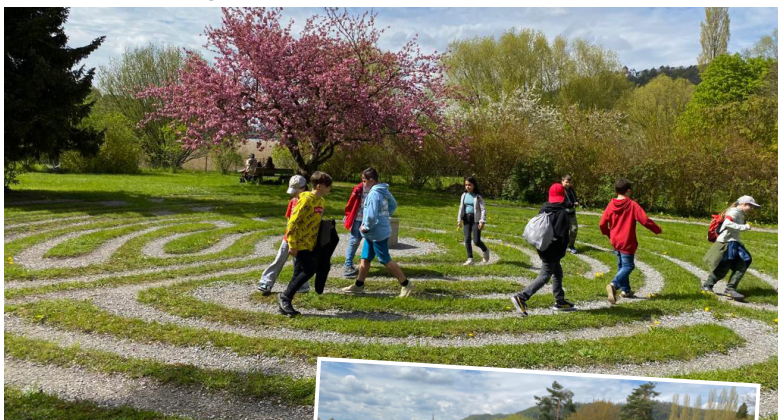
Ausflug von Club 4+5 aus Ossingen