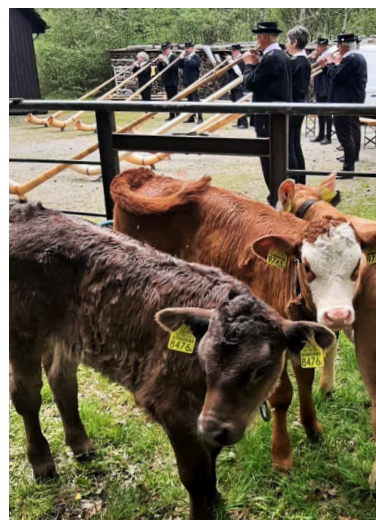
Kälber und Alphornklänge