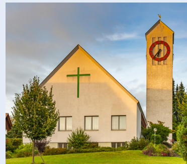
Kirche Truttikon im Abendlicht

Fr, 7., und Sa, 8. Juli Übernachten in der Kirche Truttikon Weitere Informationen folgen per E-Mail