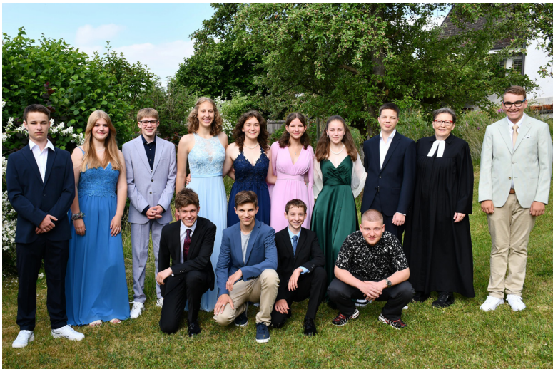
Konfirmation in Ossingen am 11. Juni 2023