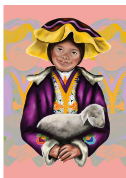
ganzes Bild zur Frontseite