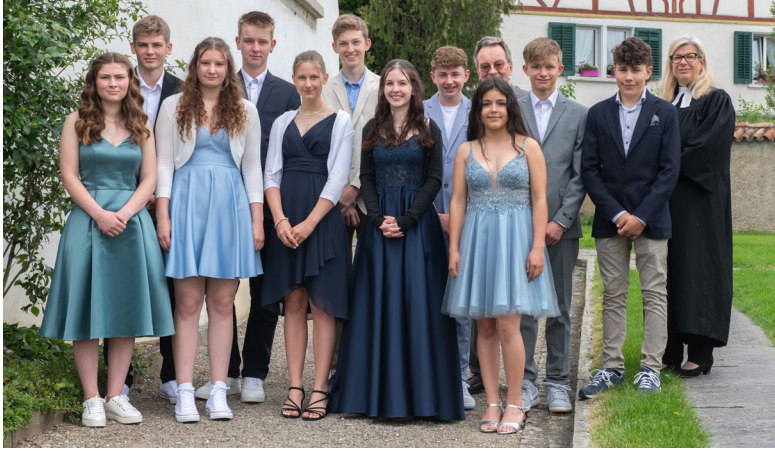
Konfirmation in Marthalen am 4. Juni 2023

Wunderschön gekleidet und bei herrlichem Wetter konnten die Konfirmandinnen und Konfirmanden ihre Konfirmation feiern. Gottes Segen begleite euch auf dem spannenden Weg in eure Zukunft!